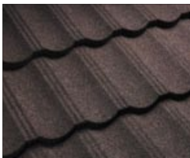
Blachodachówka HERITAGE II

Powłoka: alucynk (150 g/m 2 ), zapewniająca