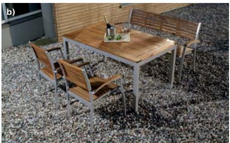
fot. Decolor Home &amp; Garden