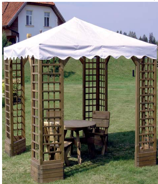
Ażurowe konstrukcyjne słupki altanki nadają jej lekkość i przestronność