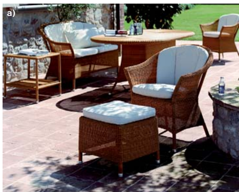
fot. Decolor Home &amp; Garden