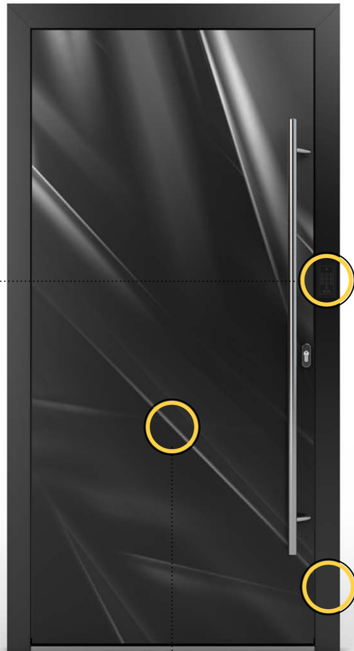
Model 15 | Wzór 1