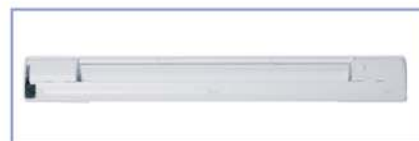
nawiewnik higrosterowany EMM