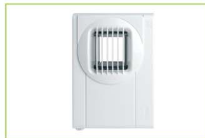
higrosterowana kratka wyciągowa do wentylacji mechanicznej BXL