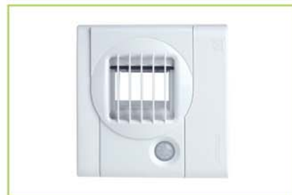
higrosterowana kratka wyciągowa do wentylacji mechanicznej BX5