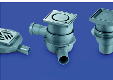
Wpusty łazienkowe KesselDesign