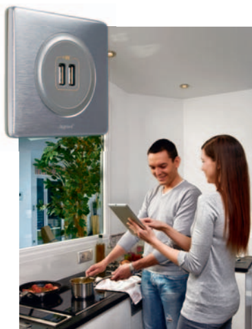
Gniazdo zasilające 2 x USB Celiame – Tytanowy

Podwójny port zasilający USB gwarantuje utrzymanie ładunku i porządku w dobie nadmiernej ilości ładowarek do przenośnych urządzeń multimedialnych. Umieszczenie gniazda w łatwo dostępnym