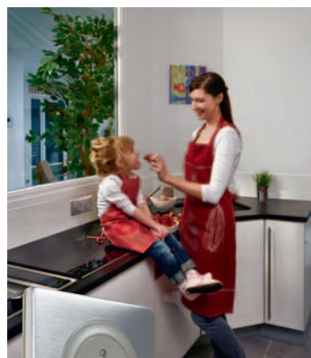
Gniazdo zasilające płaskie 230 V~ Celiame – Tytanowy

Gniazdo zasilające płaskie Celiame to prawdziwy komfort użytkownika. Dzięki licowanej powierzchni, gniazdo z ramką jest bardzo łatwe do czyszczenia, dlatego warto je zainstalować np. w kuchni nad blatem kuchennym. Gniazdo takie otwiera się dopiero po włożeniu wtyczki, która zwalnia blokadę ruchomego dna oraz przesłony styków prądowych. Po wyjęciu