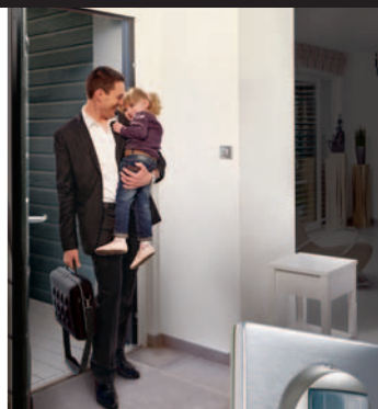
Łącznik automatyczny Celiame – Tytanowy