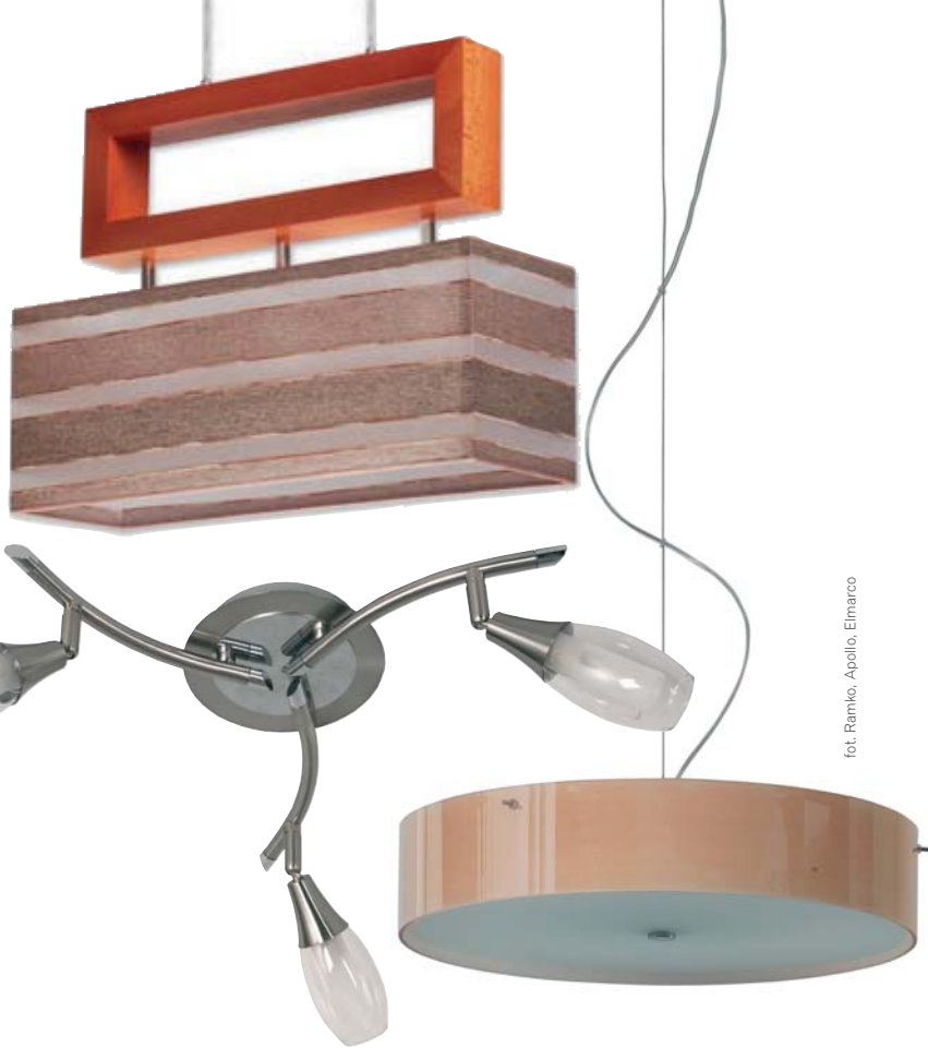
fol. Ramko, Apollo, Elmarco

Pomieszczenie to, jak każde inne w domu, powinno mieć mocny akcent. Może nim być wyszukany mebel – stylowa kanapa z luksusową tapicerką i cenny obraz albo lustro