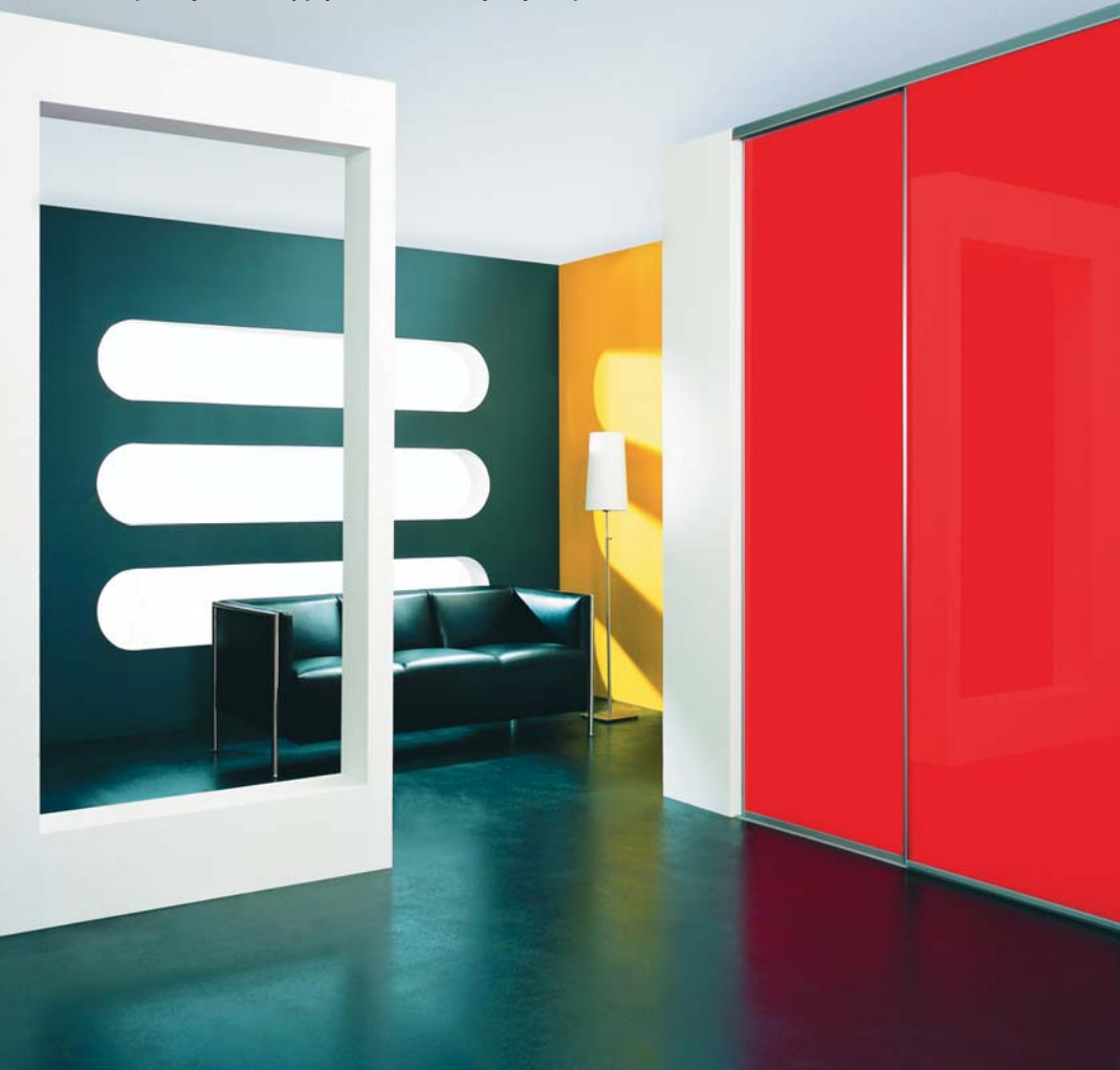
fol. Komandor fol. Komandor

Wnętrza, w których brak zdecydowanej granicy między poszczególnymi pomieszczeniami, urządzamy zachowując jednorodność stylistyczną