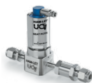
ZAWÓR MEMBRANOWY ZINTEGROWANY Z FILTREM