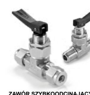
ZAWÓR SZYBKOODCINAJĄCY seria H-1200