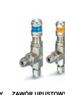
ZAWÓR UPUSTOWY seria H-900 HP