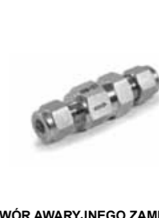
ZAWÓR AWARYJNEGO ZAMKNIĘCIA seria H-911