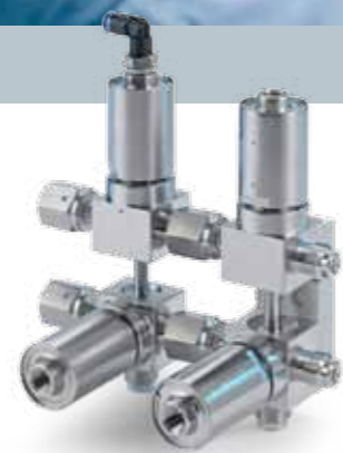
KOLEKTOR WYSOKIEJ CZYSTOŚCI