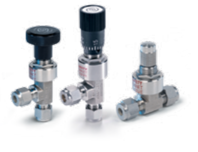
ZAWORY DOZUJĄCE seria H-1300