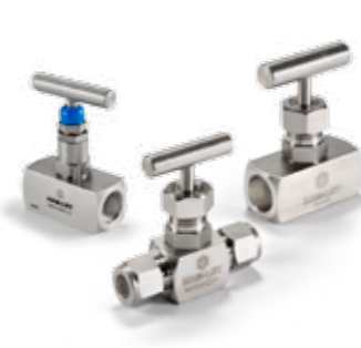
WYSOKOCIŚNIENIOWE ZAWORY IGLICOWE seria H-98 i H-98HP / H-99HP