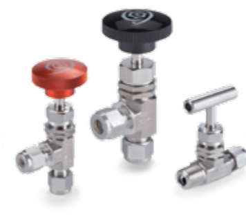
ZAWORY IGLICOWE seria H-300