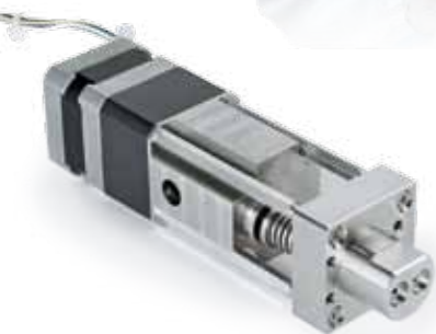
ZAWÓR Z SILNIKIEM KROKOWYM