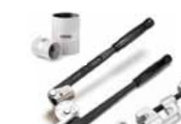
AKCESORIA DO RUR