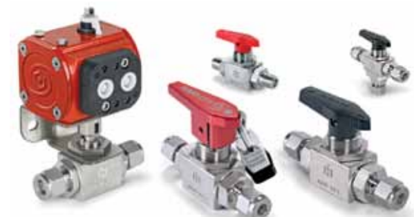
WYSOKIEJ WYDAJNOŚCI ZAWORY KULOWE seria H-6800