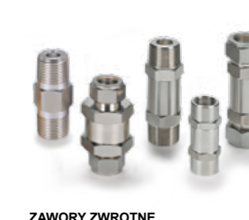
ZAWORY ZWROTNE seria H-400