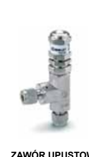
ZAWÓR UPUSTOWY seria H-900