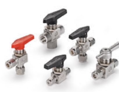
ZAWORY KULOWE seria H-800