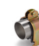
OBEJMY DO RUR