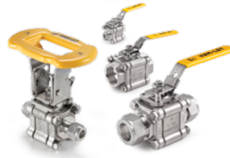
3-CZĘŚCIOWE ZAWORY KULOWE seria H-500