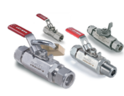
ZAWORY KULOWE seria H-700