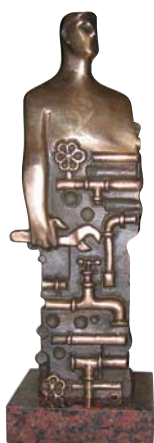
Złoty Instalator 2007