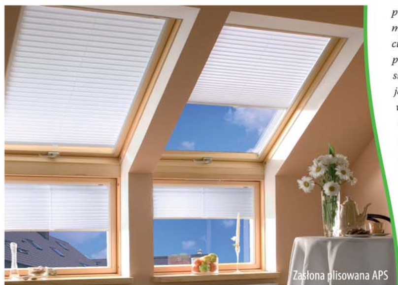
Zasłona plisowana APS

Przez cały rok z utęsknieniem czekamy na nadejście słonecznego, upalnego lata. Jednak słońce – tak miłe na plaży, może być też uciążliwe. Najlepszą ochroną przed upałem są akcesoria zewnętrzne (markiza, roleta), które zatrzymują promienie słoneczne na zewnątrz nie dopuszczając do nagrzewania wnętrza. Szczególnie ważne jest stosowanie akcesoriów zewnętrznych w mocno nasłonecznionych pomieszczeniach od strony południowej. Optymalnym rozwiązaniem jest markiza zewnętrzna, dzięki której możemy cieszyć się komfortem na poddaszu, za przystępną cenę. Markiza chroni przed nadmiarem słońca i skutecznie zaciemnia wnętrze, przy jednoczesnym zapewnieniu widoczności na zewnątrz. Dzięki temu można stworzyć oazę odpoczynku podczas upalnych, słonecznych dni.