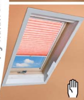
Zastana plisowana APS