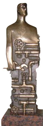
Złoty Instalator 2007