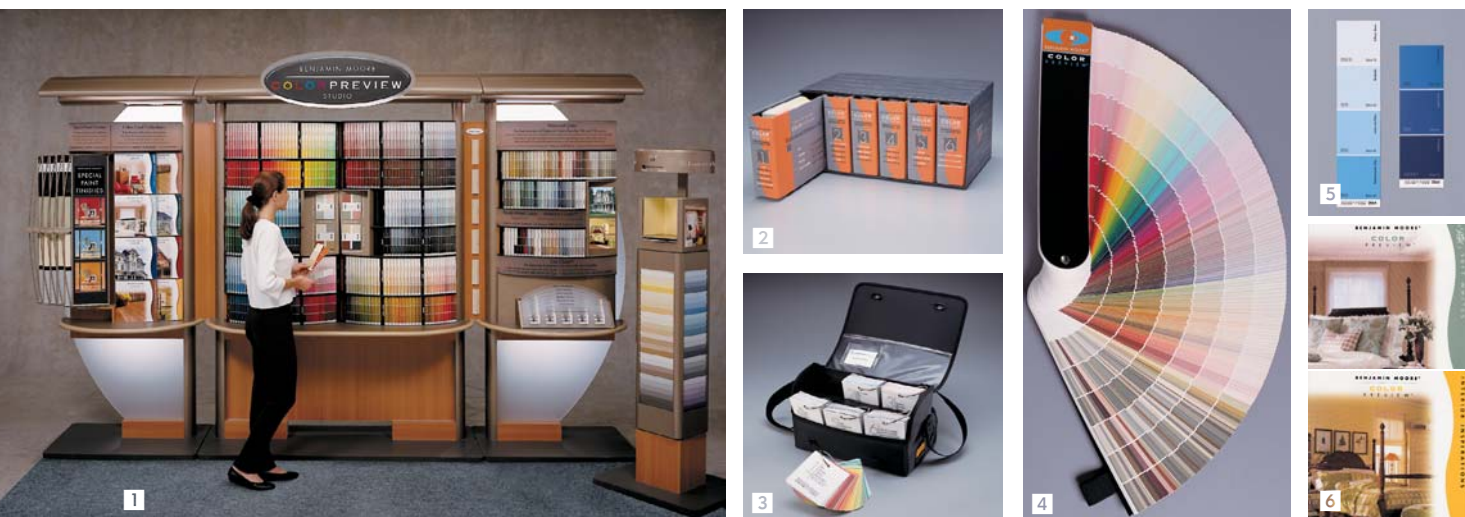
Narzędzia do wyboru kolorów: 1. Szafa kolorów 2. Segregatory z ilustracjami kolorów 8" x 8", 3. Teczka z próbkami 4" x 4", 4. Wachlarz-paleta, 5. Kartoniki z szafy kolorów, 6. Katalogi z wzorami najefektowniejszych barw.

Benjamin Moore & Co. jest renomowanym producentem wyrobów stosowanych do podnoszenia estetyki i funkcjonalności domów, mieszkań, biur oraz obiektów użyteczności publicznej. Z marką Benjamin Moore Paints związany jest nowoczesny system kolorowania (mieszalnie farb). Wysoka wydajność, siła krycia, wł. tiksotropowe (ekonomiczne malowanie) oraz trwałość (odporność na ścieranie, utrzymanie estetycznego wyglądu, zachowanie barwy) oraz bardzo bogata oferta kolorystyczna to główne atuty wyrobów marki Benjamin Moore Paints. Na stronie www.benjaminmoore.pl znajdują się: biblioteki kolorów dla architektów i dekoratorów (AutoCAD i Photoshop), informacje o wyrobach wraz z niezbędnymi atestami, wersja demonstracyjna programu do wizualizacji oraz potrzebne adresy i lista referencyjna.