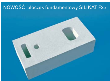
NOWOŚĆ bloczek fundamentowy SILIKAT F25

potwierdzona tradycją i stosownymi badaniami. Oczywiście tak jak w przypadku bloczków betonowych trzeba je zabezpieczyć odpowiednią izolacją w zależności od warunków grunto-wodnych.