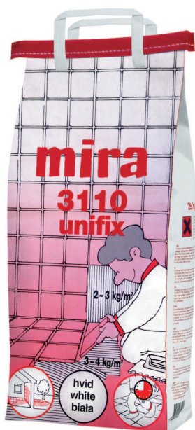
mira 3110 UNIFIX biały C2TE S1