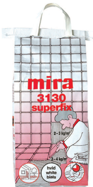
mira 3130 SUPERFIX biały C2TE S2