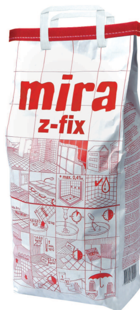
mira Z-FIX biały C2TE S2