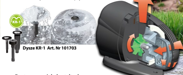
Dysze KR-1 Art. Nr 101703

Idealne do domowych (AQUAJET PFN 500) oraz małych ogrodowych oczek wodnych (AQUAJET PFN 1000-2000). Zapewniają filtrację mechaniczną i doskonałe natlenienie wody oraz pozwalają na tworzenie unikalnych efektów rozprysku. ◀