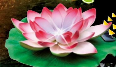
SOLAR LILY LIGHT Art. Nr 215073