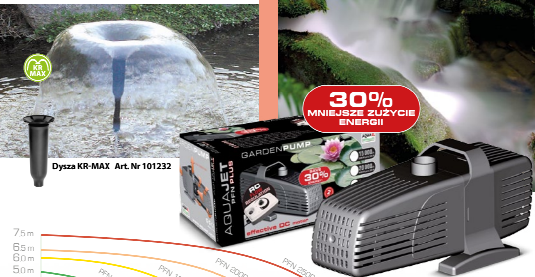
Dysza KR-MAX Art. Nr 101232

Potężne pompy do oczek wodnych o pojemności powyżej 20 m 3 . Są wyposażone w silniki BLDC, które zużywają średnio o 37% mniej energii niż inne pompy o podobnej wydajności. Niezastąpione w tworzeniu wysokich kaskad, wodospadów, fontann. Świetnie nadają się do napędu dużych filtrów. Mogą pracować zarówno w wodzie jak i poza wodą jako wydajne pompy przepływowe. ▼ Wąż 3/4" Art. Nr 101162 Wąż 1" Art. Nr 101211