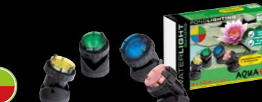
WATERLIGHT QUADRO 4X10W Art. Nr 100497