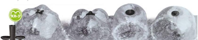
Dysze KR-3 Art. Nr 103027

Chcesz uzyskać niepowtarzalny efekt rozprysku wodnego? To łatwe! Wystarczy wyposażyc Twoją pompę PFN w odpowiednio dobrane wymienne dysze fontannowe. Zestaw dysz KR-1 współpracuje z pompą PFN 500, KR-3 współpracuje z pompami PFN 1000, 1500, 2000 i 3500, zaś dysza KR-MAX z pompami PFN 5500, 7500 i 10000. ▼