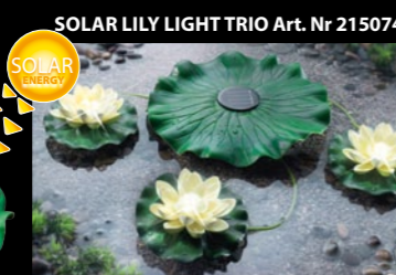
SOLAR LILY LIGHT TRIO Art. Nr 215074