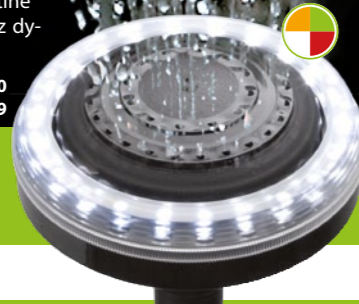
LIGHTPLAY RING L Art. Nr 102469