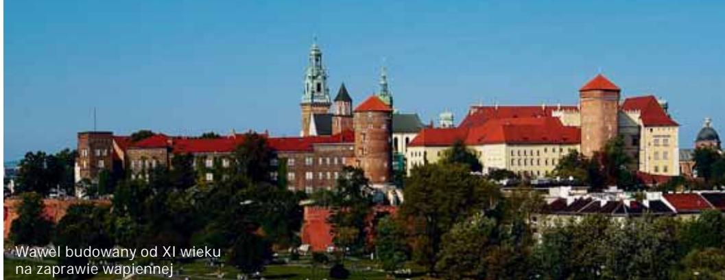
Wawel budowany od XI wieku na zaprawie wapiennej