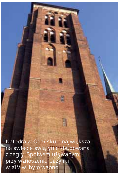
Katedra w Gdańsku – największa na świecie świątynia zbudowana z cegły. Spoiwem używanym przy wznoszeniu bazyliki w XIV w. było wapno