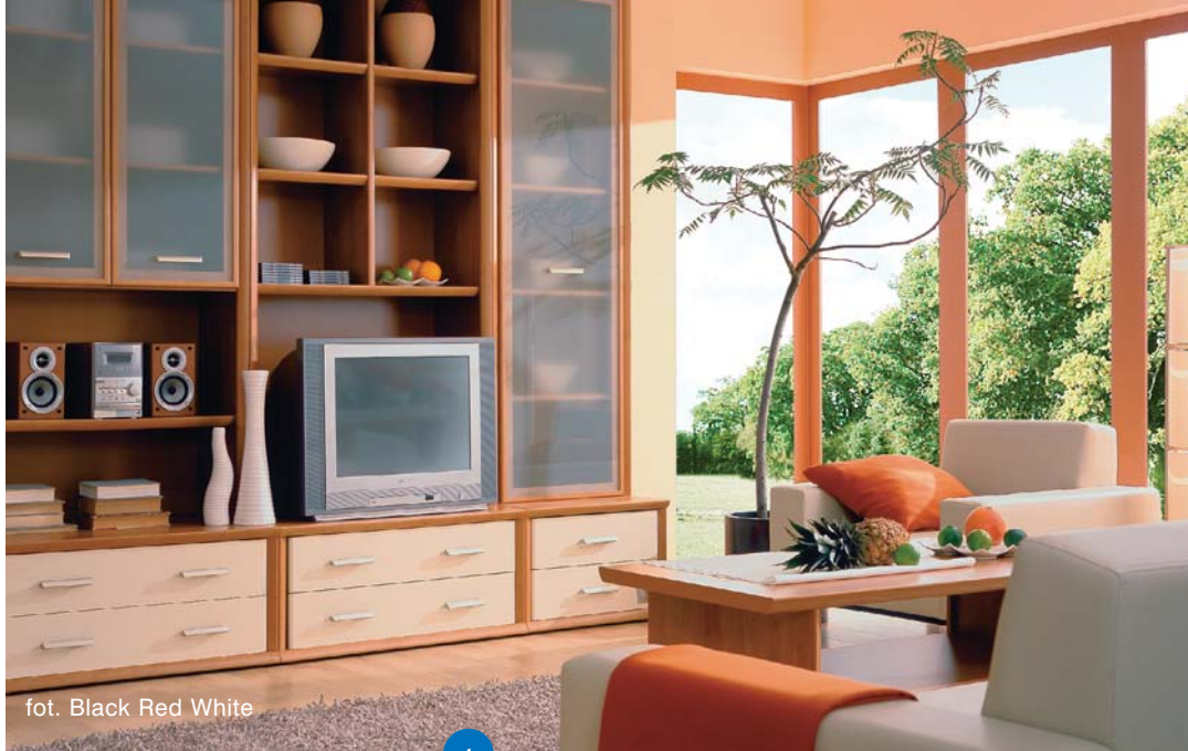
fot. Black Red White

Dzisiejszy salon, to jednocześnie część wypoczynkowa i jadalnia, zwykle otwarte na kuchnię, hol i ogród. Ludzie, po okresie ciasnych M-3, marzą o przestrzeni. Nowy styl wiąże się też ze współcześnie wypracowanym sposobem spędzania czasu wolnego. Szybkie tempo życia i potrzeba ekonomicznego wykorzystania czasu w domu, rodzą nowe pomysły – ich przejaw widoczny jest właśnie w nowym sposobie projektowania wnętrz. Dzięki otwartym przestrzeniom możemy towarzyszyć bliskim przy wielu czynnościach jednocześnie. Wspólne gotowanie, spożywanie posiłków, rozmowy przy stole, oglądanie telewizji, czy czytanie dzieciom bajek przy kominku, są elementami integrującymi i przyczyniają się do zacieśnienia więzi rodzinnych. Zatem to czynności charakterystyczne dla danego miejsca –