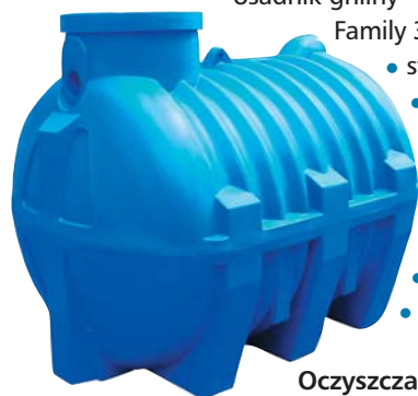
Oczyszczalnia ze złożem