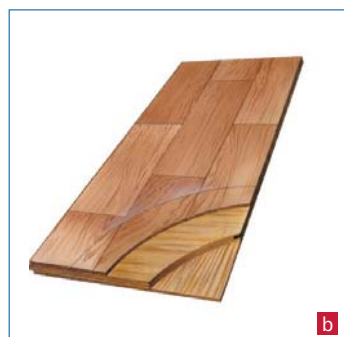
▲ Wytrzymałość paneli zależy od budowy warstwy środkowej. Może być ona wykonana z płyty HDF (a) lub MDF (b)