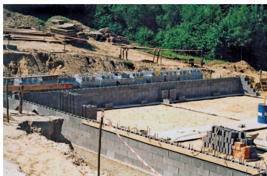
Uniwersalne Pustaki Szalunkowe CC-1 – Koszt elementów na fundamenty domu jednorodzinnego o powierzchni użytkowej około 100 m 2 wynosi około 2100 zł netto. Oszczędność w porównaniu z tradycyjnymi fundamentami wynosi w zależności od projektu od 20 do 50%. Pustaki Szalunkowe CC-1 są szczególnie polecane do wykonywania ścian piwnic. Cena detaliczna netto: 42 zł/m 2