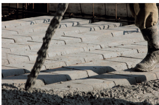
STROPY GĘSTOŻEBROWE TECHBUD 40-60 – Średni koszt kompletu materiałów na strop domu o powierzchni około 100 m 2 wynosi 4700 zł netto. Rozwiązanie to pozwala zaoszczędzić w zależności od projektu od 20 do 35 % w stosunku do rozwiązań tradycyjnych (płyta wylewana na mokro) przy znacznie lepszych parametrach akustycznych i cieplnych. Cena detaliczna netto: od 47 zł/m 2

Firma TECHBUD oferuje bezpłatne doradztwo w zakresie kosztorysowania i nadzoru na placu budowy.