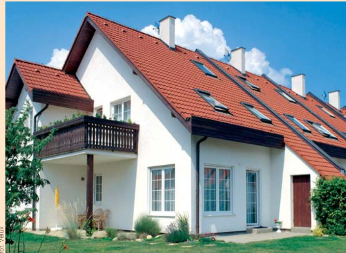
▲ Biały tynk i czerwona dachówka to kanon budownictwa jednorodzinne. Taki dom niczym się nie wyróżnia, ale i nie szpeci krajobrazu