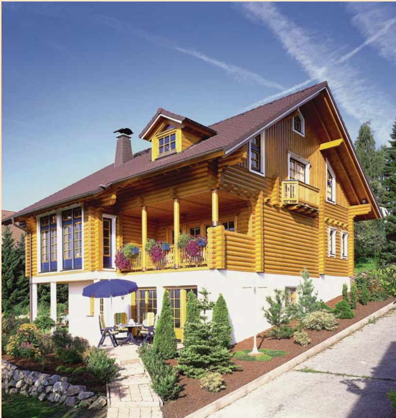
▲ W domu na zboczu doskonale sprawdza się zaakcentowanie różnych technologii: białych, murowanych ścian przyziemia, drewnianej konstrukcji mieszkalnej części budynku i ciemnego dwuspadowego dachu powodującego optyczne obniżenie domu