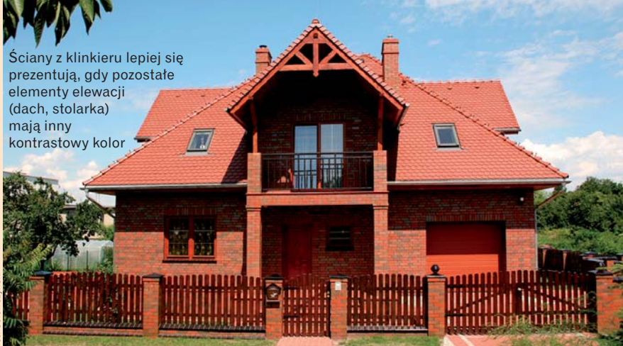
Ściany z klinkieru lepiej się prezentują, gdy pozostałe elementy elewacji (dach, stolarka) mają inny kontrastowy kolor