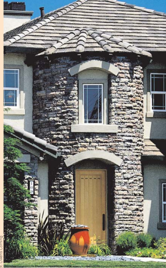
▲ Jednobarwna elewacja może być atrakcyjna pod warunkiem, że właściwie zostaną użyte materiały o odmiennych fakturach (kamień, tynk, dachówka)

Siding winylowy – to materiał imitujący drewniane deski. Umiarkowaną popularność zawdzięcza stosunkowo niskiej cenie, łatwości montażu oraz niekłopotliwej eksploatacji. Jednak jest to materiał obcy w naszej kulturze i dlatego przyjmuje się z pewnymi oporami. Na dodatek przy wprowadzaniu go na rynek zabrakło dobrych wzorców do naśladowania. Przez to wiele budynków obłożonych sidingiem nie wygląda zbyt atrakcyjnie, ponieważ podstawowym błędem była chęć naśladowania białych otynkowanych ścian. Niestety elewacja nie wygląda wtedy zbyt efektownie. Główne płaszczyzny powinny być koloro-