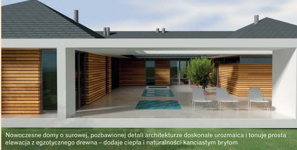
Nowoczesne domy o surowej, pozbawionej detali architekturze doskonale urozmaica i tonuje prosta elewacja z egzotycznego drewna – dodaje ciepła i naturalności kanciastym brytom