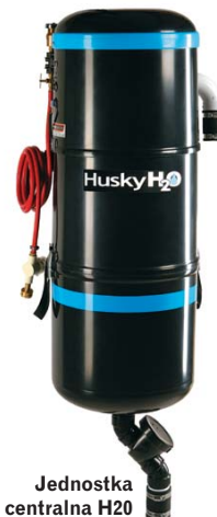
Jednostka centralna H2O