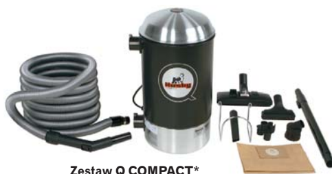
Zestaw Q COMPACT*