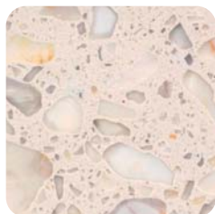
Calacatta Arabescato Bianco