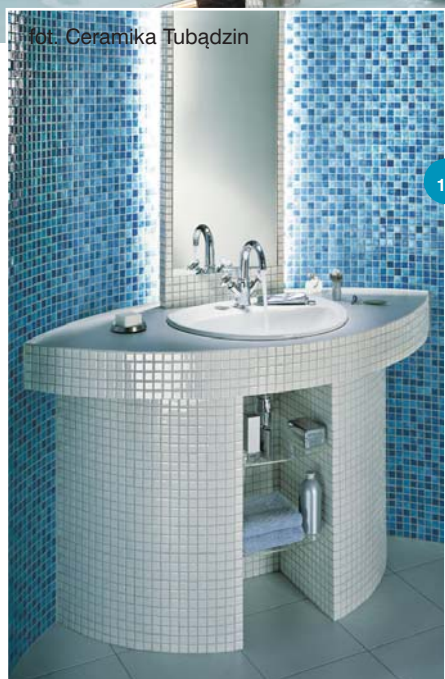
fot. Ceramika Tubądzin