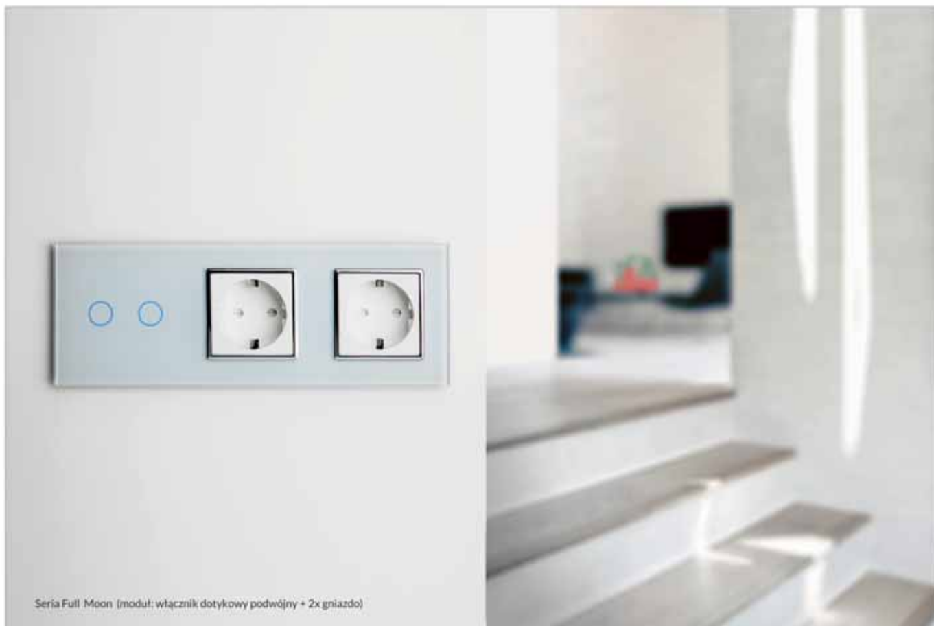
Seria Full Moon (moduł: włącznik dotykowy podwójny + 2x gniazdo)