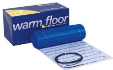
Maty grzejna ELEKTRA MD

Montaż: w warstwie zaprawy klejowej lub w wylewce samopoziomującej