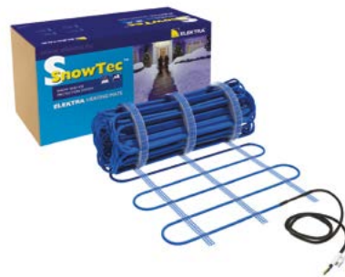
Maty grzejne ELEKTRA SnowTec®

Przewody grzejne ELEKTRA VCDR – dostępne w określonych długościach, zakończone przewodem zasilającym. Powłoka zewnętrzna przewodu jest odporna na działanie wysokich temperatur i promieniowania UV. Przeznaczone do zabezpieczania rynien i rur spustowych oraz ochrony połączy dachowych i krawędzi dachów przed mrozem, śniegiem czy lodem. Moc jednostkowa: 20 W/m.