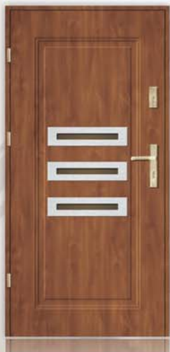
Optima INOX Tukson