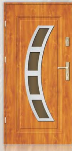
Optima INOX Atlanta