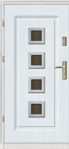
Optima INOX Denver