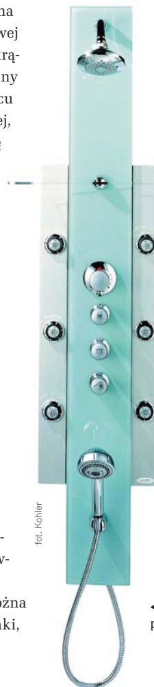
◀ Panel prysznicowy ze stali i szkła prezentuje się bardzo efektownie

Konstrukcję kabiny stanowią profile, wykonane najczęściej z lakierowanego proszkowo aluminium, powlekanego anodowo lub malowanego farbami epoksydowo-proszkowymi.