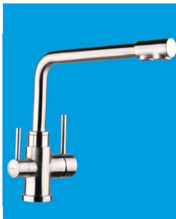
Bateria z dwoma niezależnymi obwodami: – mieszacz wody ciepłej i zimnej (prawa strona) – zawór tylko do wody filtrowanej (lewa strona)

Aprobaty i certyfikaty: Atesty Higieniczne PZH, Certyfikat US Environmental Protection Agency, Certyfikat Canadian Standards Association