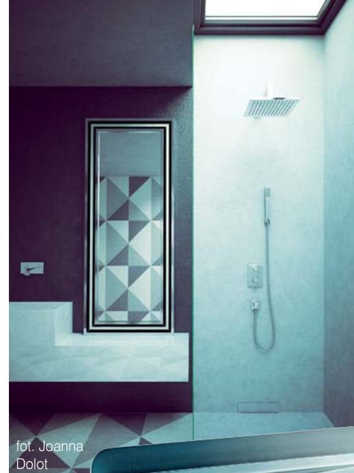
fot. Joanna Dolot