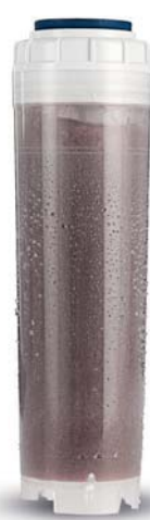
Filtr Z WĘGLEM AKTYWNYM

Zmiękcza wodę usuwając jony wapnia i magnezu, powodujące jej twardość. Twarda woda jest przyczyną powstawania kamienia kotłowego na elementach grzejnych pralek, czajników i innych urządzeń AGD.