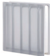
DORIC SAT 30x30x8/10

Pozostała oferta: akcesoria montażowe, zaprawy klejowe, zbrojenie, płytki wykończeniowe do pustaków szklanych, gotowe moduły z pustaków szklanych, okna wentylacyjne