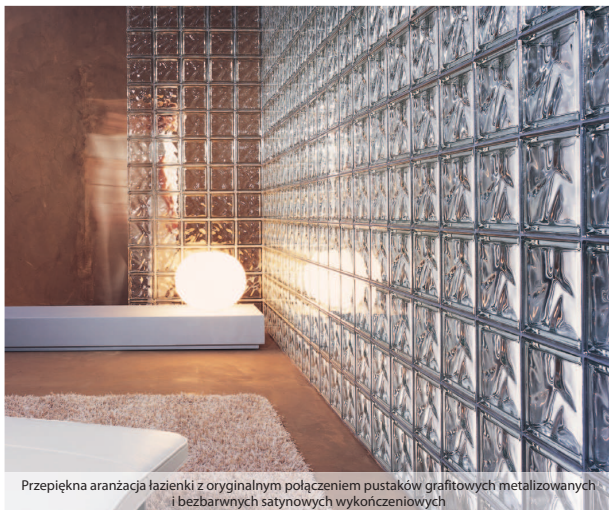
Przepiękna aranżacja łazienki z oryginalnym połączeniem pustaków grafitowych metalizowanych i bezbarwnych satynowych wykończeniowych

Zastosowanie pustaków jest bardzo szerokie i ograniczone praktycznie tylko wyobraźnią inwestora i projektanta