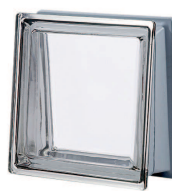
TRAPEZOIDAL MET 30x30x8/13