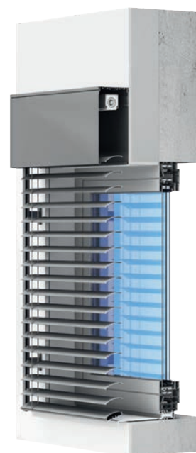
żaluzja fasadowa/adaptacyjna /nadtynkowa-uchwyt