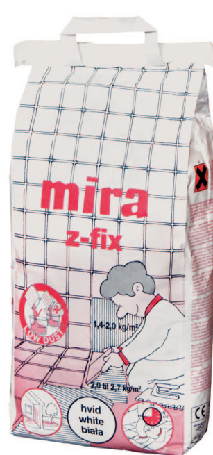
mira Z-FIX biały C2TE S1