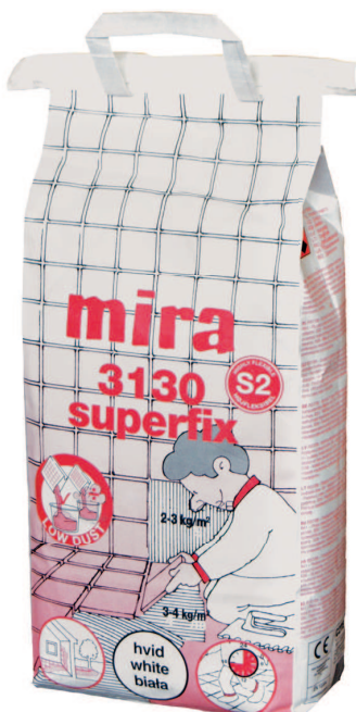
mira 3130 SUPERFIX biały C2TE S2