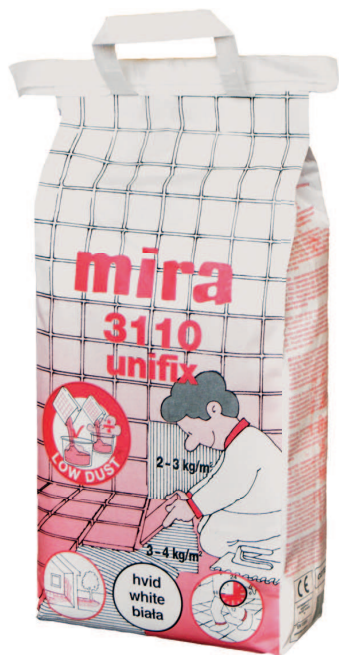
mira 3110 UNIFIX biały C2TE S1

CHEMIA BUDOWLANA / KLEJE DO PŁYTEK CERAMICZNYCH