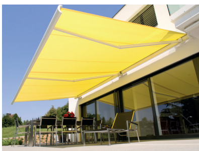
Resobox – markiza tarasowa w kasecie