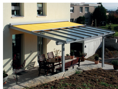
Terrado – system szklanego dachu z markizą przeciwsłoneczną