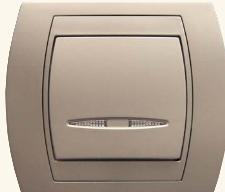
Gazela – łącznik jednobiegunowy z podświetleniem

konać do ubarwienia swojego domu czy też najlepiej czują się w pomieszczeniach urządzonych w sposób klasyczny pozostaje osprzęt w kolorze białym. Dla osób preferujących osprzęt monoblokowy obok koloru białego jako podstawowego proponowane są kolory: seledynowy, beżowy i brązowy, dając im tym samym możliwość wprowadzenia subtelnych akcentów kolorystycznych do swoich wnętrz.