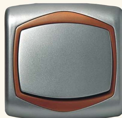
Ton – łącznik jednobiegunowy

Każdy osprzęt czy to modułowy czy monoblokowy, kolorowy czy biały znajdzie swojego zwolennika – to wszystko zależy tylko i wyłącznie od upodobania nabywcy, jego preferencji. OSPEL S.A. jako producent przedstawia Państwu możliwości i oddaje do użytku produkt wartościowy i godny uznania. Osprzęt marko-