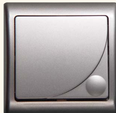
Efekt – łącznik jednobiegunowy