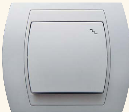
Gazela – łącznik schodowy