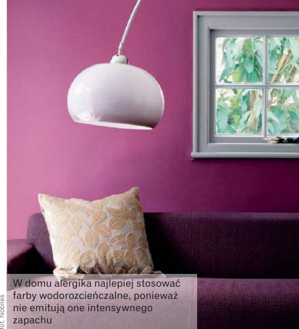
W domu alergika najlepiej stosować farby wodorocieńczone, ponieważ nie emitują one intensywnego zapachu