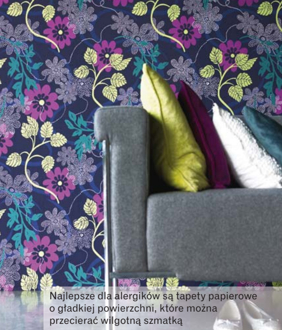
Najlepsze dla alergików są tapety papierowe o gładkiej powierzchni, które można przecierać wilgotną szmatką