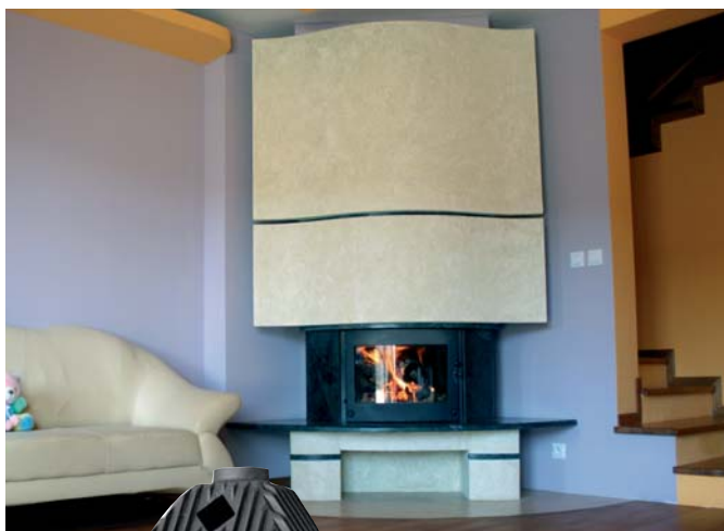
EXCLUSIVE 16 kW