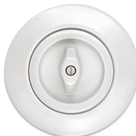
Berker Serie 1930