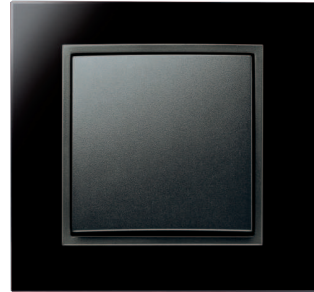
Berker B.7 Glas