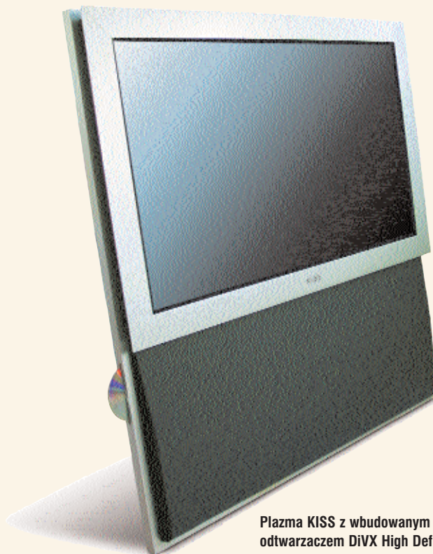
Plazma KISS z wbudowanym odtwarzaczem DivX High Definition