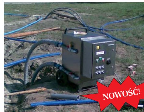
Zestaw pomiarowy do badania przewodności cieplnej gruntu metodą TRT

Dla wykonywanego pola sond geotermalnych oferujemy przeprowadzenie badania współczynnika przewodnictwa efektywnego gruntu metodą echa temperaturowego (Thermal Response Test – TRT). Badanie to polega na iniekcji ciepła do wcześniej osadzonej sondy geotermalnej. Pomiar trwa około 70 godzin. Na podstawie uzyskanych pomiarów ciepła oraz temperatury zasilania i powrotu wyznaczamy współczynnik efektywnej przewodności cieplnej gruntu. Współczynnik ten jest podstawą do ustalenia zdolności gruntu do oddawania lub pobierania ciepła. Dla