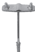
Uchwyt do bednarki i drutu