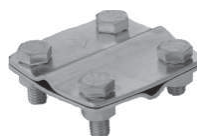
Złącze krzyżowe 4xM8