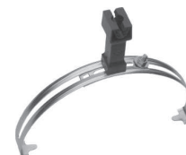
Uchwyt gaśniorowy uniwersalny