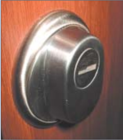
Ostona wkładki zamka od strony zewnętrznej drzwi (tzw. kopułka osłaniająca)

do klasy 6). Drzwi klas A i B mają jedynie podwyższoną odporność na włamanie. Najwyższą odpornością charakteryzują się drzwi klasy C (odpowiednio – unijnie klasy 3-4) te są klasyfikowane jako antywłamaniowe. Po ich zamontowaniu, jeżeli producent ma podpisane umowy z ubezpieczycielami, otrzymacie stosowne zniżki w składce ubezpieczeniowej, a agent nie może od Was żądać zastosowania dodatkowego, certyfikowanego zamka. Mając natomiast drzwi klasy A (tańsze) na pewno taki zamek musicie mieć. Warto się więc zastanowić, czy lepiej kupić drzwi tańsze i wydać zaoszczędzone pie-