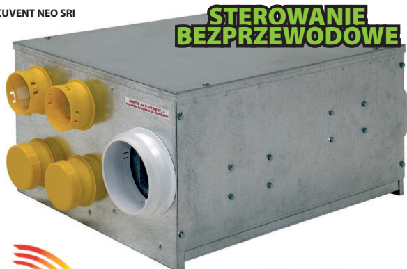
RECUVENT NEO SRI