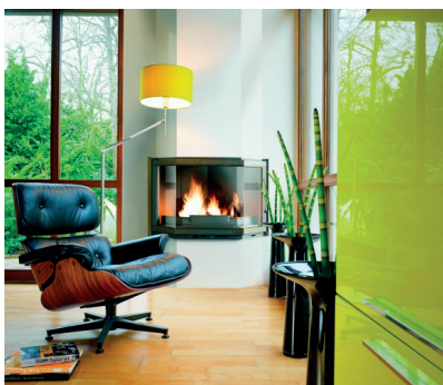
Laudel Przymatyczny 850