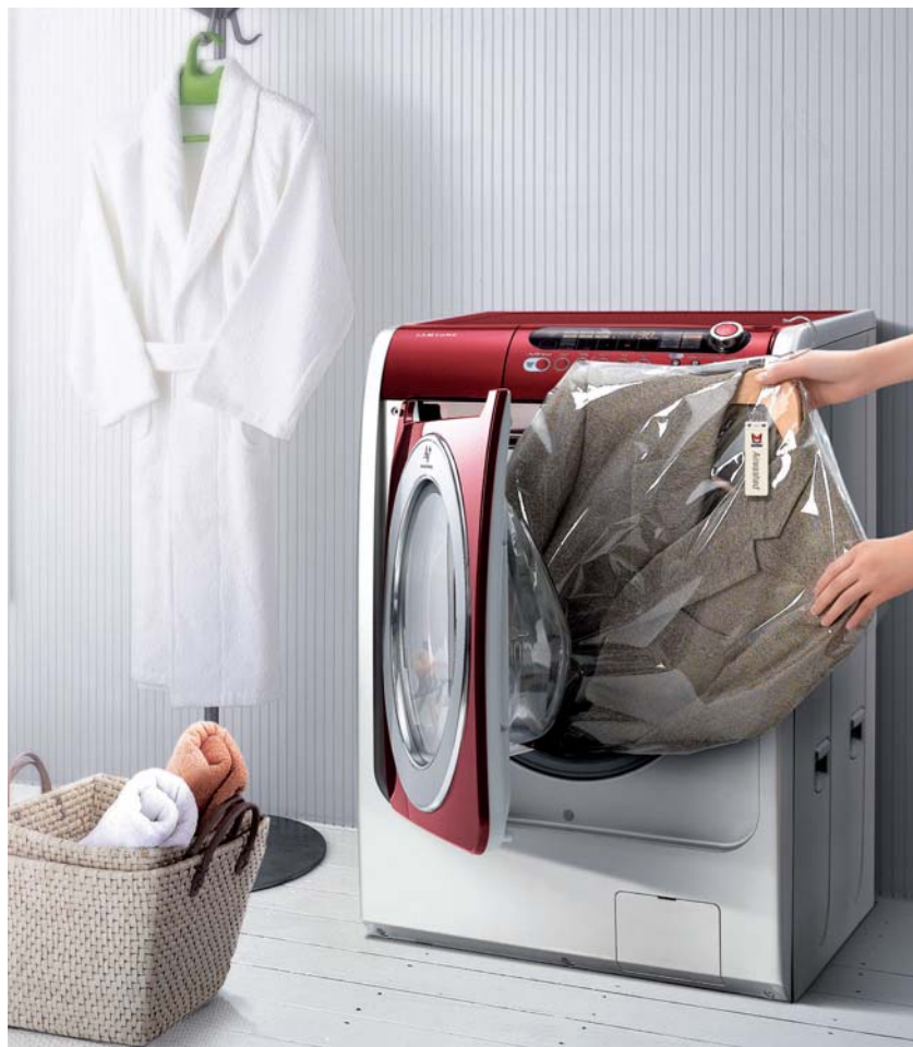
Pralka ładowana od frontu wygląda atrakcyjniej od tej ładowanej od góry