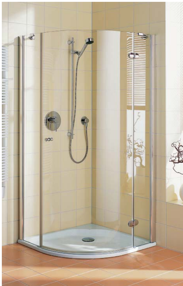
Narożna kabina prysznicowa to najpopularniejsze rozwiązanie