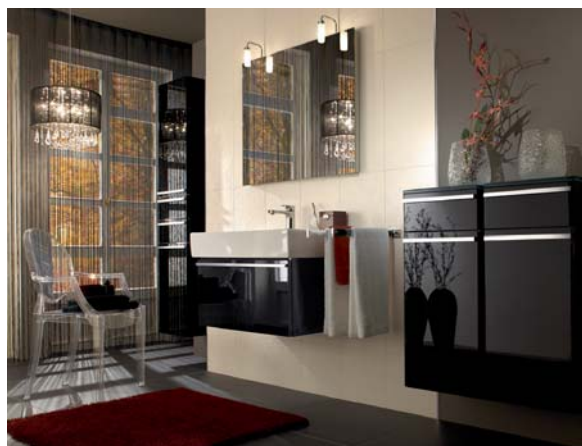
Dwie nieduże lampki umieszczone po obu stronach umywalki to najważniejsze źródła światła w łazience

Oświetlenie ogólne – górne lub boczne spłaszcza pomieszczenie i optycznie je zmniejsza. Warto więc zainstalować kilka punktów świetlnych. Niewątpliwie najważniejsze w łazience jest oświetlenie lustra nad umywalką. Powinny to być dwie umieszczone po jego bokach lampki. Oświetlenie nie powinno rzucać cienia na twarz osoby stojącej przed lustrem, ani odbijać się w nim. Jeśli lubimy czytać w wannie, możemy obok niej umieścić lampkę, najlepiej z regulowanym kątem padania światła. Dla bezpieczeństwa należy stosować oprawy hermetycznie zamykane, przeznaczone do pomieszczeń o podwyższonej wilgotności.