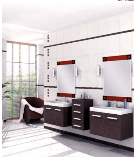
Meble łazienkowe oferowane są w wielu kolorach i stylach