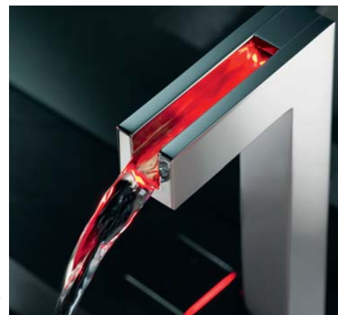
Bateria umywalkowa może mieć futurystyczny styl

Ścienne natynkowe natomiast na ścianie nad umywalką. Ponieważ wymagają zainstalowania rur pod tynkiem, prace instalacyjne trzeba wykonać przed ostatecznym wykończeniem łazienki. Podobnie w przypadku baterii podtynkowych, podłączenie rur i elementy mieszające trzeba ukryć w ścianie, w specjalnych puszkach. Ze ściany wystają tylko pokrętła do wody i wylewka. Baterie bidetowe są bardzo podobne do umywalkowych. Różni je jedynie perlator, który zamocowany jest na przegubie, umożliwiającym ustawienie kierunku strumienia wody. W większości baterie montowane w bidecie to baterie stojące.