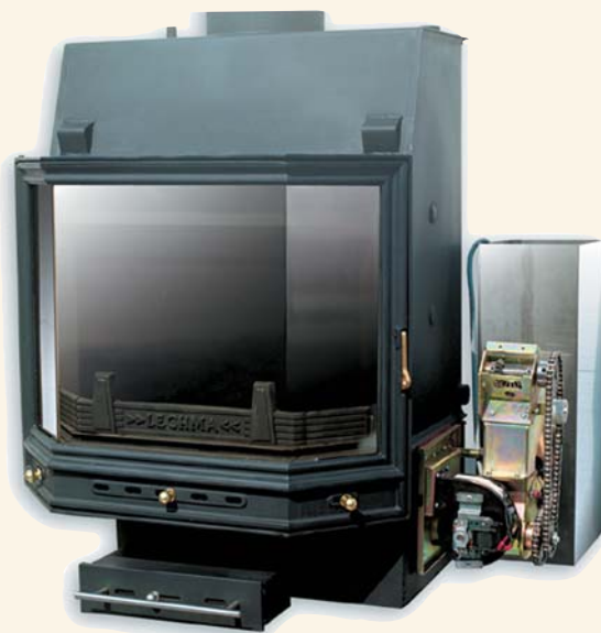
Kominek pryzmatyczny z podajnikiem

W pełni zautomatyzowane urządzenie, pozwalające na palenie w kominku w sposób ciągły. Paliwo jest dostarczane przez specjalny podajnik z zewnętrznego zasobnika. Rozwiązanie powyższe umożliwia zarówno korzystanie z tradycyjnego paliwa jak i ekologicznego śrutu (pellets).