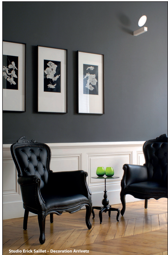
Studio Erick Saillet – Decoration Arrivetz