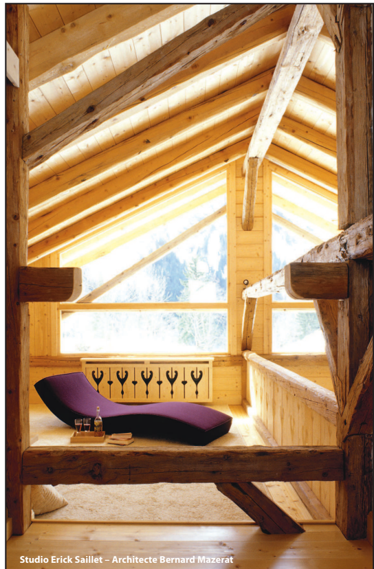
Studio Erick Saillet – Architecte Bernard Mazerat