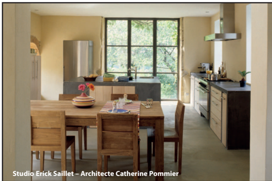
Studio Erick Saillet – Architecte Catherine Pommier