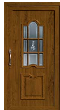
H 441 PVC