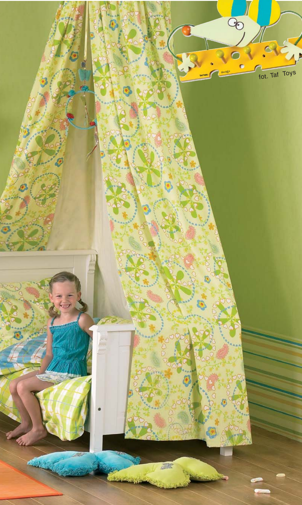
fot. Taf Toys